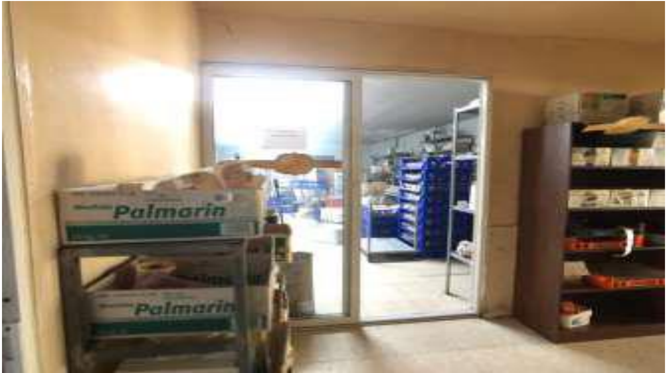
0/5838, Αρ. οικοπέδου 17