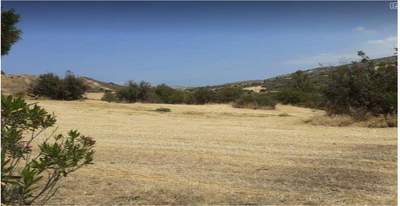
Ακίνητο με αρ. εγγραφής 0/4263