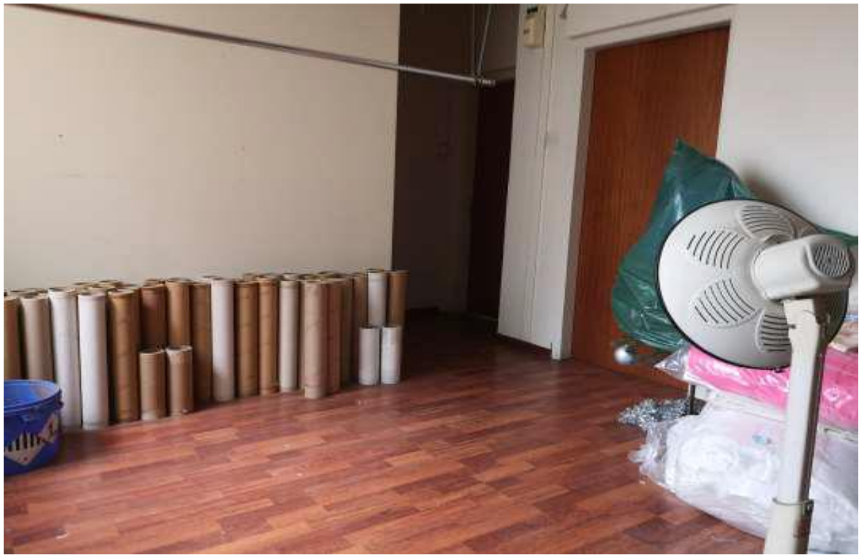
Κατάστημα αρ. εγγραφής 3/2710