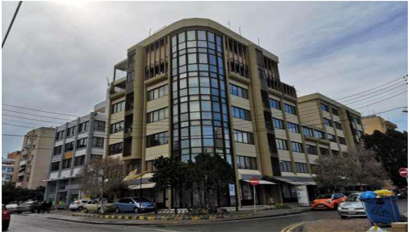
Κατάστημα αρ. εγγραφής 3/2709